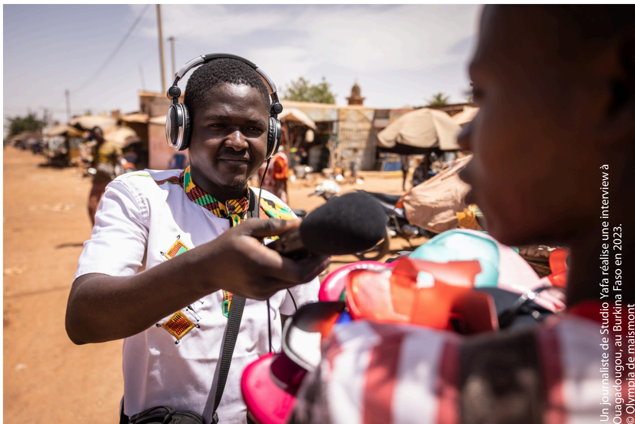
Un journaliste de Studio Yafa réalise une interview à Ouagadougou, au Burkina Faso en 2023.