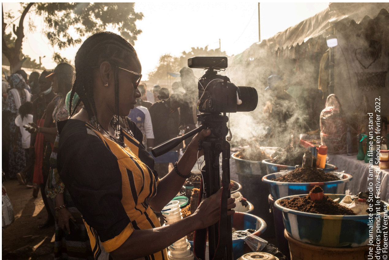
Une journaliste de Studio Tamani filme un stand d'épices pendant le Festival de Ségou en février 2022.