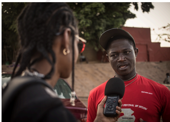
Une journaliste de Studio Tamani interviewe un ancien guide touristique de Segou au Mali.

Au-delà des formations régulières, Studio Tamani organise aussi des activités de soutien aux médias locaux à travers des formations éditoriales, techniques et managériales ainsi que des sessions d'immersions pour des journalistes et étudiant-e-s en journalisme. Le partenariat mis en place avec les universités pour rehausser le niveau des étudiant-e-s et proposer des stages en journalisme est renforcé avec des sessions intensives organisées pour les étudiant-e-s.