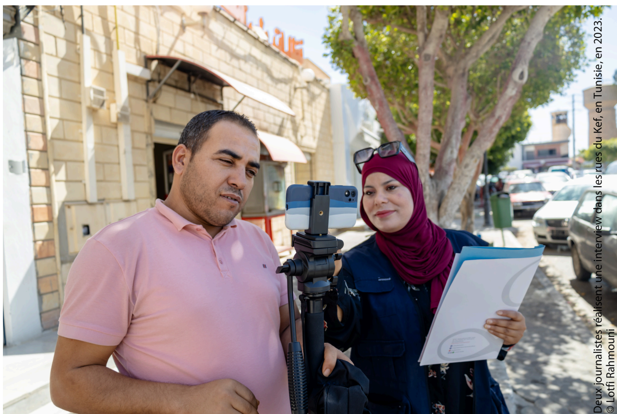
Deux journalistes réalisent une interview dans les rues du Kef, en Tunisie, en 2023.