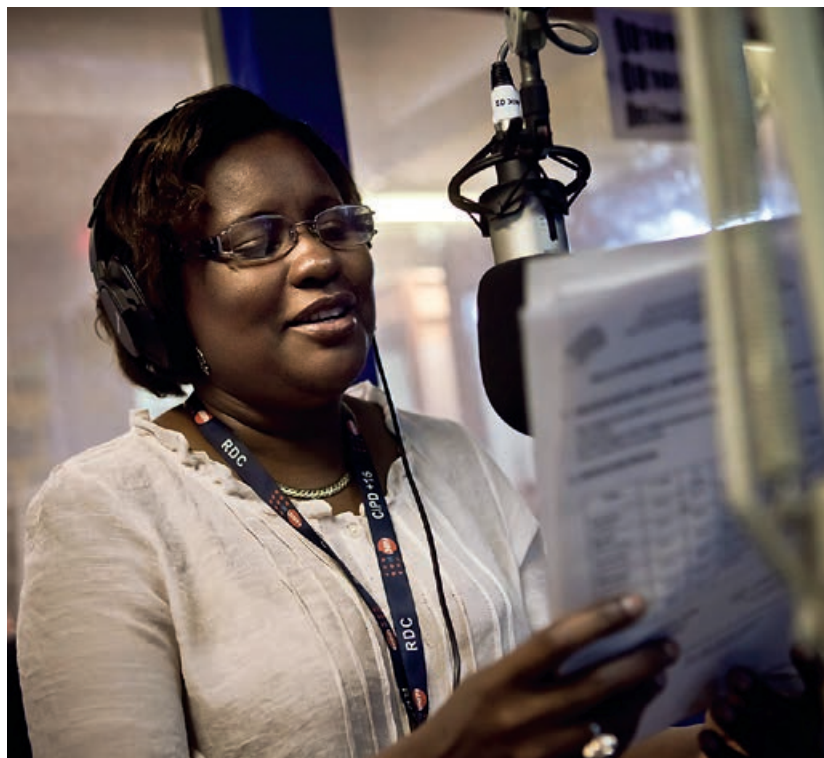
© Rédaction de Radio Okapi (Photo : Gwenn Dubourthoumieu/FH)