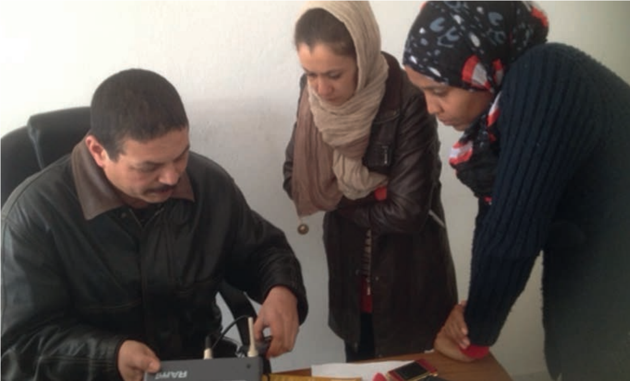
© Formation technique aux journalistes de Radio Gafsa. Photo M Vuillemoz/Fondation Hironnelle

Nos équipes ont adopté la même méthode participative, en pleine concertation avec l'ensemble des équipes de Direction et de Production et avec l'appui des nouvelles compétences transférées auprès des cadres de Radio Gafsa.