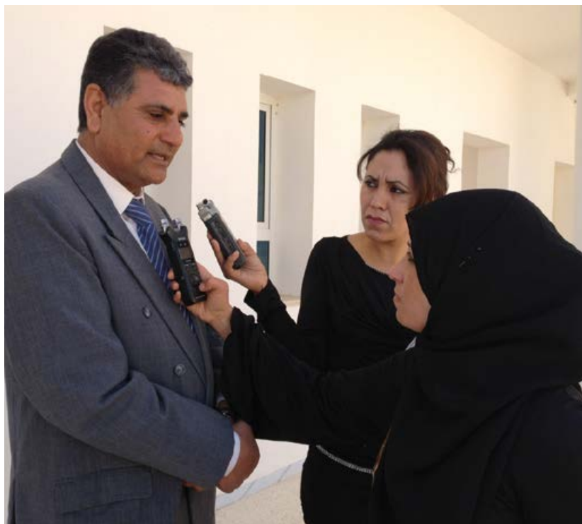
© Journaliste du bureau régional de Kebili réalisant une interview d'un officiel. Photo MAkl/Fondation Hironnelle