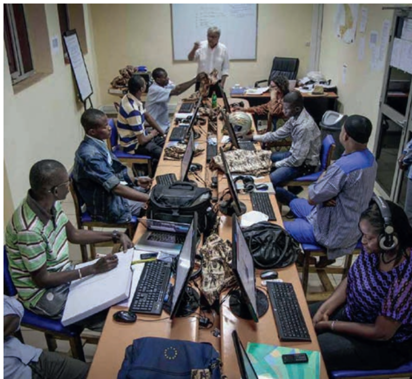
© Rédaction du Studio Tamani (Photo : Marc Ellison/ Fondation Hironnelle)