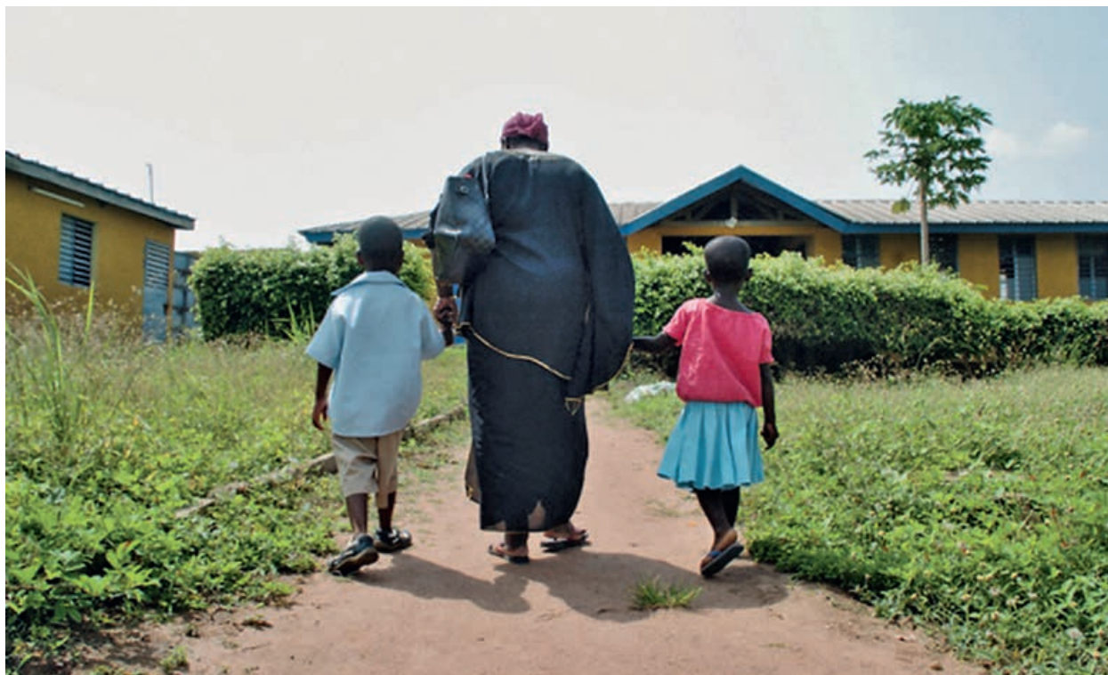
© Côte d'Ivoire (Photo: Culture Counts)

La Fondation Hironnelle aura particulièrement en charge la définition et la mise en œuvre des contenus pédagogiques et éditoriaux garantissant le professionnalisme des formations et des productions du Studio Mozaik.