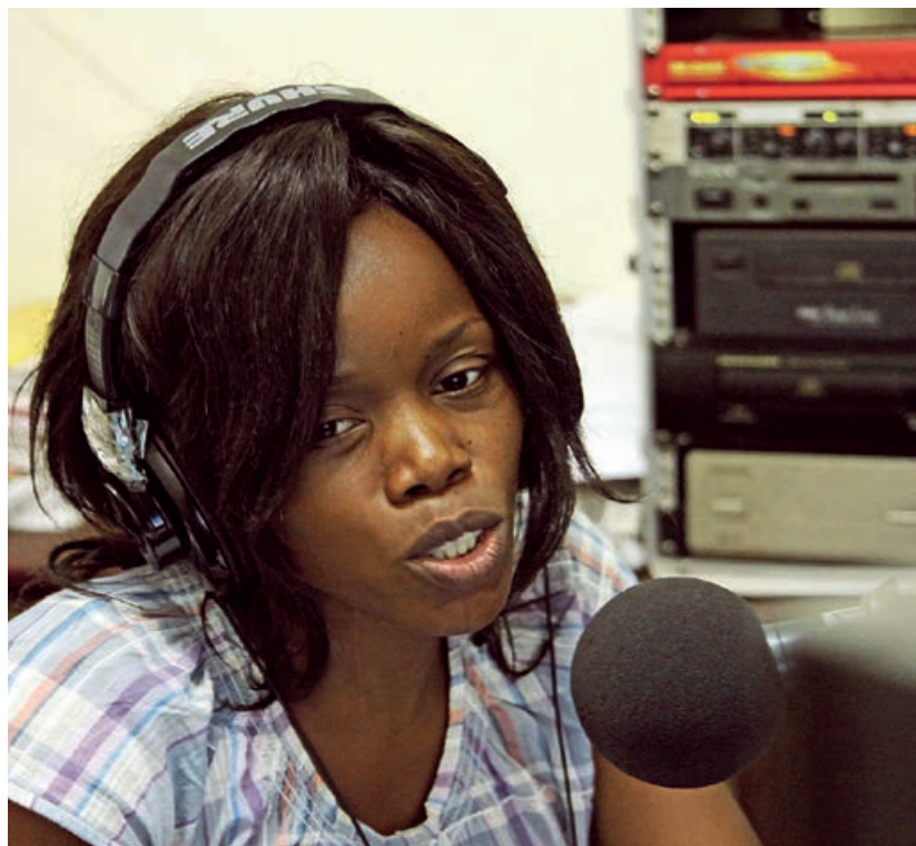
© Studio de Radio Ndeke Luka (Photo : Jean-Luc Mootoosamy/ Fondation Hirondelle)