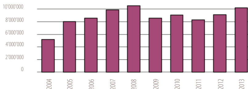
Evolution des dépenses globales sur dix ans (en CHF)

La Fondation enregistre un résultat positif tout en ayant pu faire les investissements indispensables à une gestion efficace et professionnelle des opérations ; il s'agit principalement d'investissements au niveau des infrastructures IT et dans les locaux de la Fondation à Lausanne, d'un renforcement des ressources humaines et d'un appui financier à la Fondation Hironnelle USA. Le résultat opérationnel montre un excédent de 106'304 CHF, la perte de change s'élève à 21'344 et compte tenu de quelques autres charges et produits financiers, l'exercice se termine sur un excédent de recettes de 89'170 CHF.